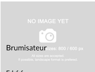
Brumisateur sizes: 800 / 600 px All sizes are accepted. If possible, landscape format is preferred.