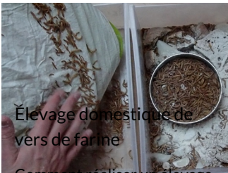
Élevage domestique de vers de farine

Comment réaliser un élevage de vers de farine chez soi ?