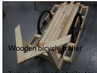
Wooden bicycle trailer

Two-wheel wooden trailer for transporting 2m50 objects.