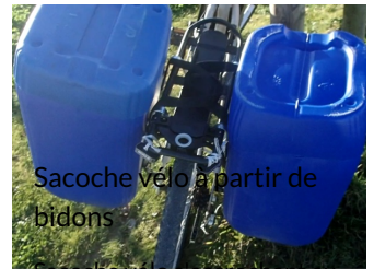
Sacoche vélo à partir de bidons