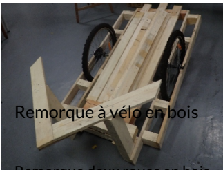
Remorque à vélo en bois

🌐 https://www.helloasso.com/associations/low-tech-lab-paris