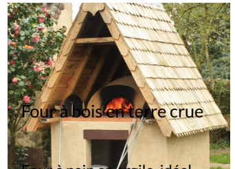
Four à pain en argile