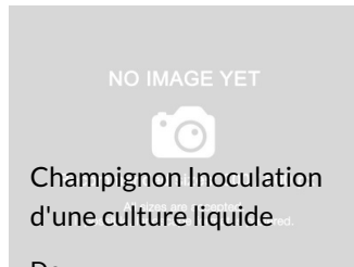
Champignon Inoculation d'une culture liquide ed.