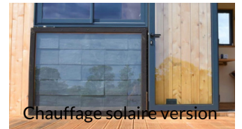
Chauffage solaire version ardoise