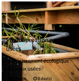
Purification de l'eau usées