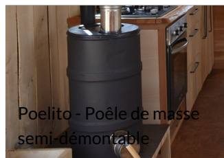
Poelito - Poêle de masse semi-démontable

Poêle de masse à inertie semi-démontable.