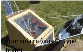
Four solaire (cuiseur type boîte)