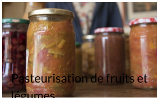
Pasteurisation de fruits et légumes