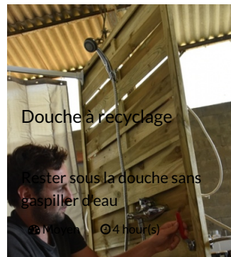
Douche à recyclage

Rester sous la douche sans gaspiller d'eau