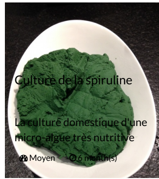
Culture de la spiruline

La culture domestique d'une micro-algue très nutritive