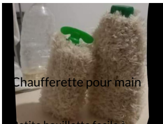
Chaufferette pour main