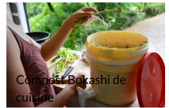
Compost Bokashi de cuisine