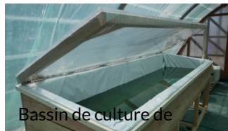
Bassin de culture de spiruline

Construction d'un bassin de culture de spiruline rehaussé