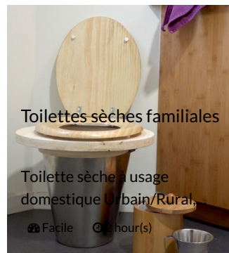
Toilettes sèches familiales

Toilette sèche à usage domestique U/bain/Rural,