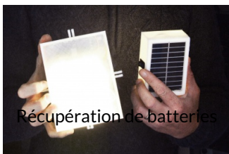
Récupération de batteries