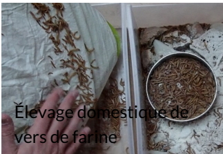
Élevage domestique de vers de farine

Comment réaliser un élevage de vers de farine chez soi ?