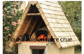
Four à pain en argile, idéal