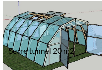
Serre tunnel 20 m2

Serre fabriquée à partir de palettes de récupération