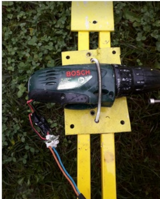
Perceuse démontée avec raccordement des câbles avec sucre électrique.

Pas de plus haute résolution disponible.